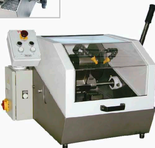
TR60 – TR70 Tischmodell