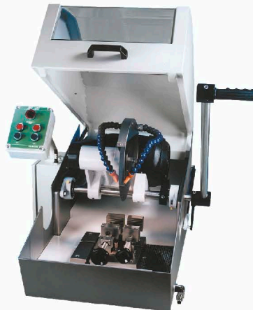
TR80 – TR100 Tischmodell